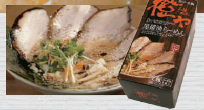
6012 橙や 黒醤油らーめん 2食入 756円