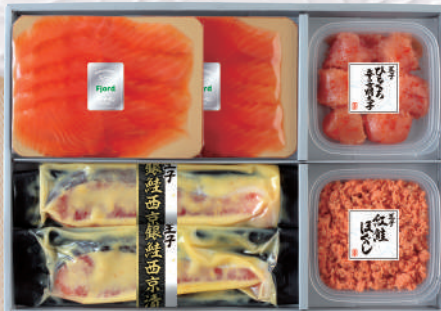
D-30 スモークサーモン・海の幸 ・漬魚詰合わせ