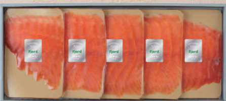
D-34 スモークサーモン姿切り