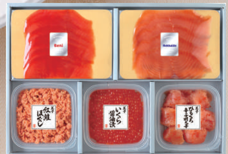
D-31 スモークサーモン ・海の幸詰合わせ