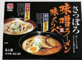
5434 さっぽろ味噌生ラーメン味比べ 4食入 1,296円