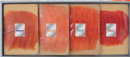
D-33 スモークサーモン4種セット