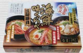
83691 北海道限定 海鮮味くらべ 三麺勝負 3食入 950円