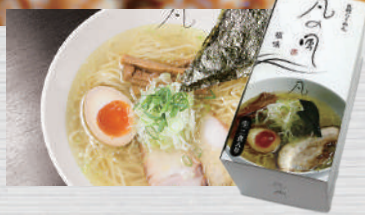
60135 凡の風 塩味 2食入 756円