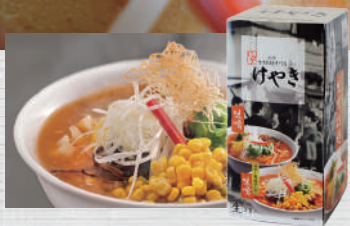
9932 にとり けやき バター風味 コーン味噌 2食入 700円