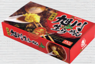
4727 旭川生ラーメン 4食入 1,296円